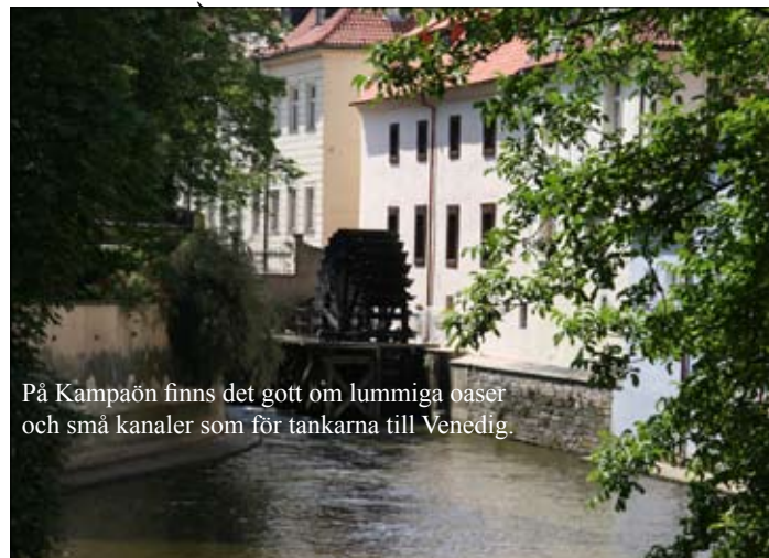
På Kampaön finns det gott om lummiga oaser och små kanaler som för tankarna till Venedig.