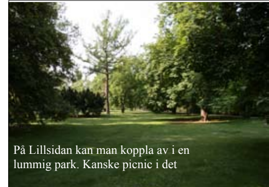
På Lillsidan kan man koppla av i en lummig park. Kanske picnic i det

Och redan på planet hem drömmer jag om nästa besök i Prag - mina drömmars stad. ♥