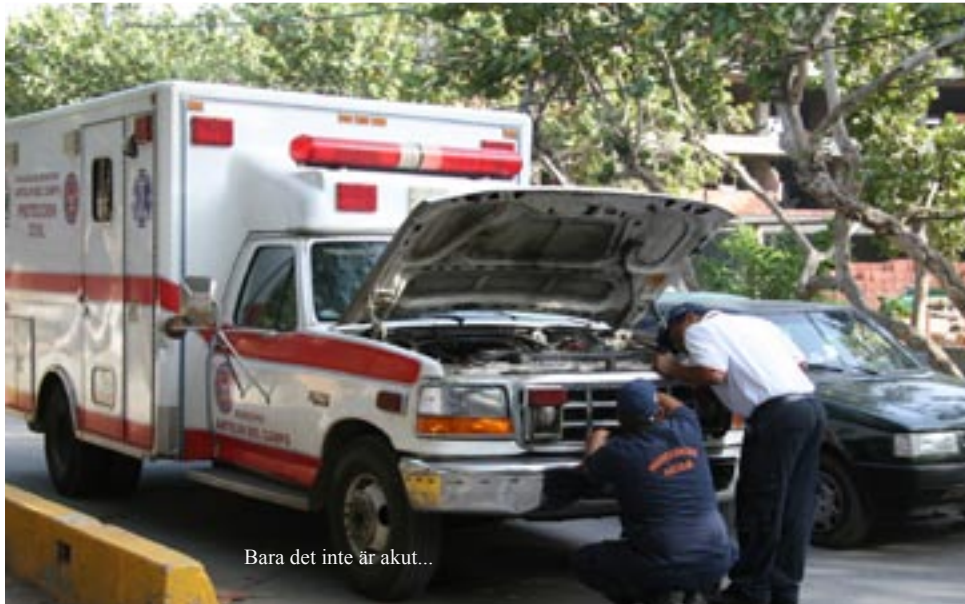
Bara det inte är akut...

Det var i regel god och variationsrik mat, i barerna var drinklistan omfattande med ganska sötsliskiga drinkar som serverades i plastmuggar.