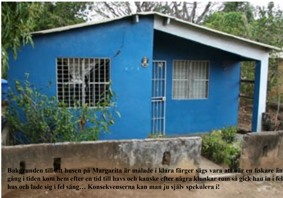
Bakgrunden till att husen på Margarita är målade i klara färger sägs vara att när en fiskare än gång i tiden kom hem efter en tid till havs och kanske efter några klunkar rom så gick han in i fel hus och lade sig i fel säng... Konsekvenserna kan man ju själv spekulera i!

När pensionsåldern infinner sig ska man ska kunna visa intyg på att man har arbetat i cirka trettiofem år och intyget sänds till huvudstaden Caracas för handläggning. Precis som allting annat så tar även denna handläggning tid, ungefär tre år är handläggningstiden innan man äntligen kan få sina pensionspengar! På Isla Margarita lever 40 procent av invånarna på fiske och resten av invånarna får sin inkomst genom turismen. Hantverket som utförs i byarna säljs mestadels till turisterna. Än så länge kan man dock hitta genuint hantverk som inte har blivit alltför turistanpassat. I byn Cercado med cirka åttahundra invånare lever de flesta av inkomster från keramik tillverkning. Färgerna är starka och mustiga och priserna för vackra hantverk mycket låga.